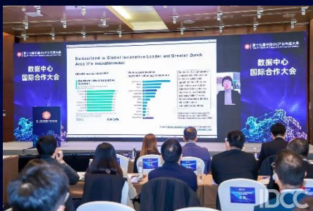
瑞士大苏黎世区经济促进署