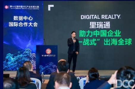
里瑞通 (Digital Realty)